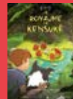
Le royaume de Kensuké