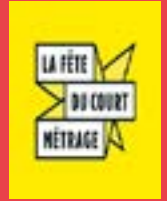
Fête du court-métrage