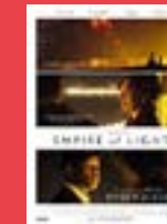
Empire of Light