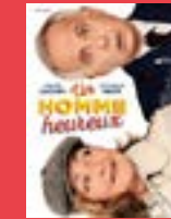
Un homme heureux