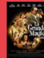
La grande magie